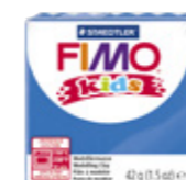
FIMO® Kids boetseerlei