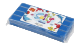
Pasta da modellare morbida