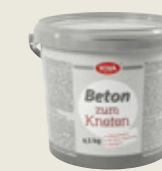
Cemento artistico modellabile

Per gioielleria e decorazioni ultra fini da cuocere in forno