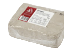
Argilla di porcellana