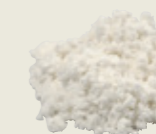
Pasta di cartapesta