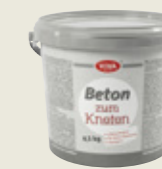
Beton til modellering

Til smykker og ultrasmå pynteting til hærkning i ovn