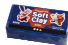
Soft Clay Modellervoks

finish du ønsker. Ostevoks er derimod for større børn og voksne, da den før brug skal opvarmes. Den bruges til traditionel modellering og til beklædning af tråd-skeletter.