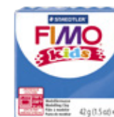
FIMO® Kids Clay