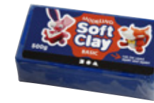
Soft Clay Knetmasse

für ältere Kinder und Erwachsene, da das Material vor der Verarbeitung erwärmt werden muss. Man arbeitet mit Käsewachs beim traditionellen Modellieren und zum Ummanteln von Skeletten und Rahmen aus Draht.