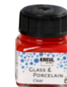
Glas- en porseleinverf