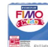
FIMO® Kids leire