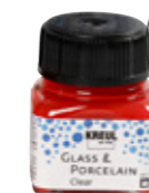
Glass og porselensmaling