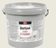
Betong til modellering

Til smykker og små pynteting til herdning i ovn