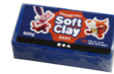
Soft Clay Modellérvoks

Ostevoks er derimot for større barn og voksne, da den før bruk skal varmes opp. Den brukes til tradisjonell modellering og til bekledding av tråd-skjeletter.