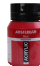
Student kunstner akrylmaling