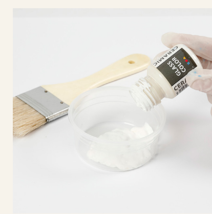
5 Kaada hieman lasimaalia sopivaan purkkiin tai muovinpalalle.