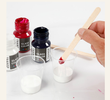
3 Sekoita erivärisiä lasimaaleja. Voit tehdä vaaleansinistä väriä sekoittamalla noin yhden teelusikallisen valkoista ja pisaran sinistä lasimaalia. Tai vaaleanpunaista sekoittamalla teelusikalliseen valkoista pisaran punaista lasimaalia.