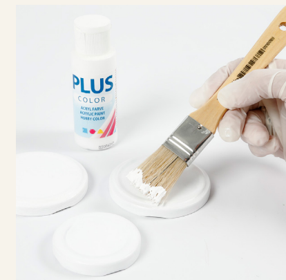
2 Maalaa kansi askartelumaalilla.