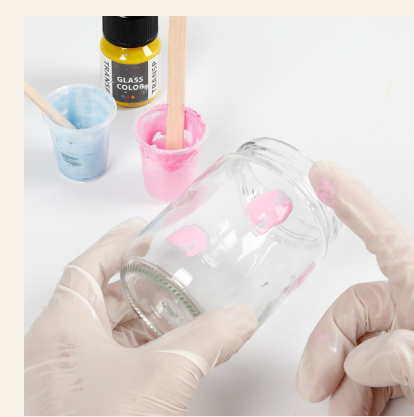
4 Laita muovikäsineet käteen ja koristele lasipurkki. Voit tehdä purkkiin erivärisiä pisteitä sormella. Anna kuivua.