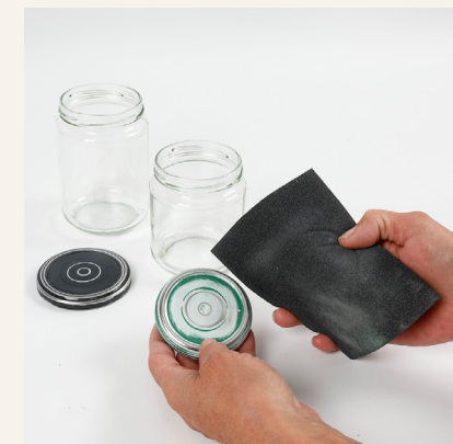
1 Puhdista lasipurkki huolellisesti ja hio kansi hienolla hiekkapaperilla.